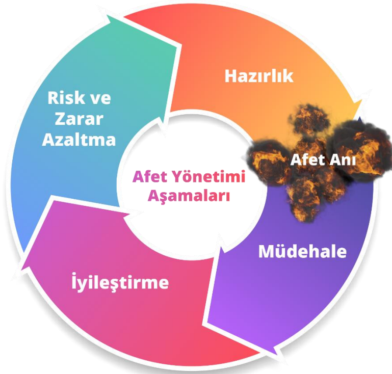
Şekil 3. Afet Yönetimi Aşamaları

Modern afet yönetimi, risk ve kriz yönetimi olarak ikiye ayrılmıştır. Risk yönetimi; kayıp ve zarar azaltma, hazırlık, tahmin ve erken uyarı ve afetleri anlamak gibi afetlerden önce yapılması gereken çalışmaları içermektedir. Kriz yönetimi ise etki analizi, müdahale, iyileştirme ve yeniden inşa gibi afetler olduğu andan itibaren başlayan ve afetlerin sonrasında devam eden çalışmaları içermektedir (Şekil 3, Kadioğlu, 2008: 2).